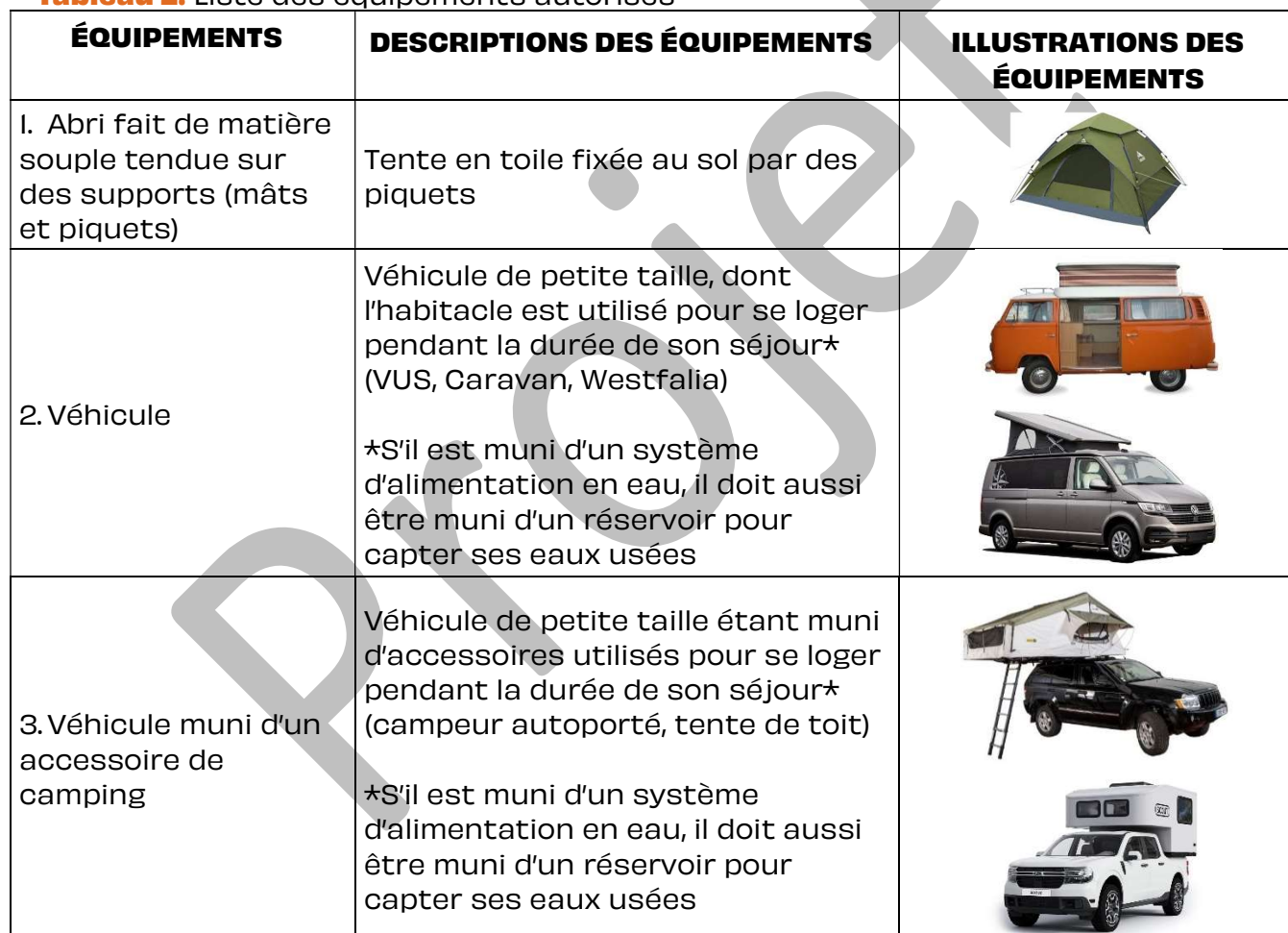
Tableau 2. Liste des équipements autorisés